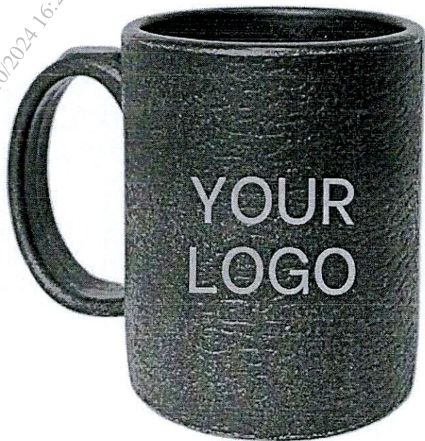
Mug Cup | 400ml

hcqt_xdcb_pas_Quan tri_24/10/2024 16:27:24